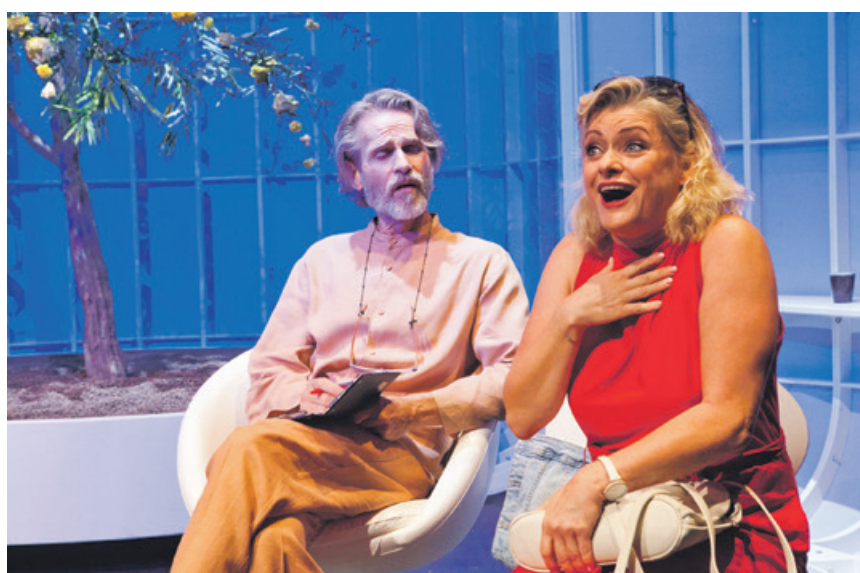
Diese wunderbare Komödie des österreichischen Erfolgsautors Daniel Glattauer ( Gut gegen Nordwind ) hat nicht nur die Kinoleinwand erobert, sondern auch die Theaterbühnen.