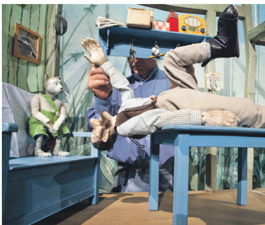
Pettersson und Findus erleben ihr inzwischen drittes Abenteuer am Bautzener Puppentheater. So spektakulär, heiter und liebenswert wurde noch kein Übeltäter in die Flucht geschlagen.

Eine Woche später, am 10. November sind ältere Kinder, Jugendliche und Erwachsene herzlichst zum neuen Weihnachtsmärchen eingeladen. Erstmals haben wir nicht nur Weihnachtsstücke für Kinder ab 4 Jahren im Programm, sondern bringen einen winterlichen Shakespeare-Stoff für Menschen ab 10 Jahren auf die Bühne: „ Das Wintermärchen “ zeigt die faszinierende Vielfalt des Marionettenspiels. Von einer Drehbühne herunter, dem nie stillstehenden Rad der Zeit und des Lebens, wird Schauerliches und Lustiges erzählt, Hass und Liebe,