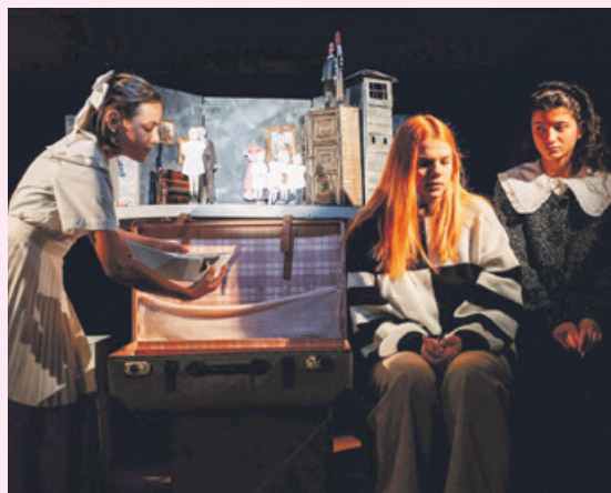
In dem sehr persönlichen und intimen Raum der Performance bewegen sich drei junge Mädchen mit Hilfe von Papierpuppen durch verschiedene Orte der Weltgeschichte, die wie in einem Puppenhaus im Miniaturformat nachgebildet sind.

A m 24. November, 16.00 Uhr werden im Burgtheater zum letzten Mal in Bautzen „Kinderszenen“ gespielt, bevor das Projekt des Thespiis-Zentrums ein allerletztes Mal im Pandatheater am 1. Dezember in Berlin gastieren.