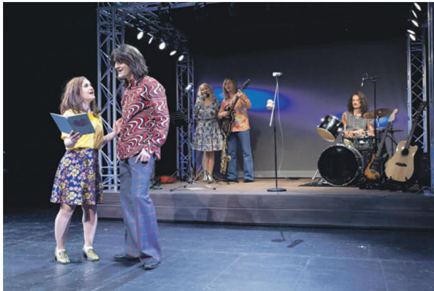
Aus persönlichen Erinnerungen der damaligen Band wird die Geschichte geknüpft, die mit viel Live-Musik die damalige Zeit und ein spannendes auf die Bühne holt.

Wir schöpfen mit diesem Stück aus dem Repertoire der damaligen Zeit und der originalen Live-Musik von HERCY. Aus persönlichen Erinnerungen der damaligen Band knüpfen wir eine Geschichte, in der wir aus der Lausitz auf die aufgewühlte Welt und das unterkühlte Verhältnis zwischen Ost und West blicken.