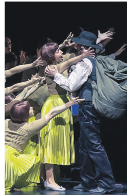
Puccinis Opernerstling „Le Villi“ wird in Bautzen insgesamt sechs Mal zu erleben sein.