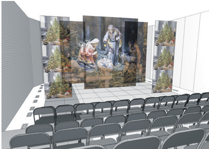
Bühnenbildentwurf Erich Uiberlacker, Bühnenbildner und Lichtgestalter

Am Heiligen Abend treffen in einem leeren Kaufhaus die Putzfrau Maria und der Sicherheitsmann Josef aufeinander, beide einsam, beide nicht mehr jung, beide nicht