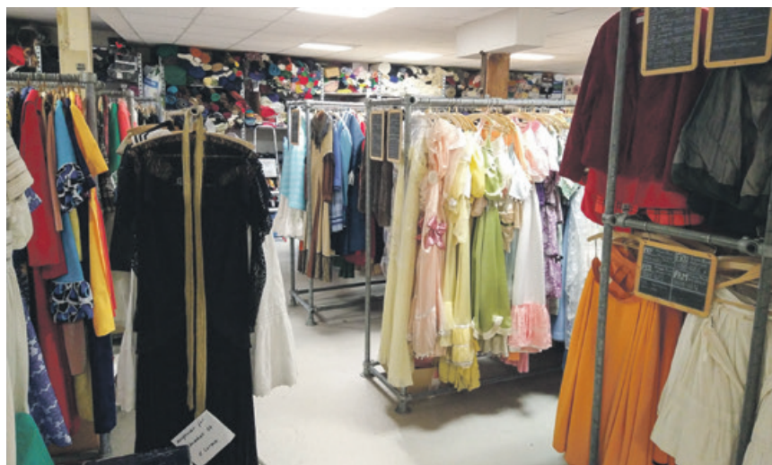
Im Kostümfundus des Theaters lagern über 20.000 Kostüme, von denen ein kleiner Teil beim Flohmarkt angeboten wird.

Hinweis: ausschließlich Barzahlung, da keine Kartenzahlung möglich ist.