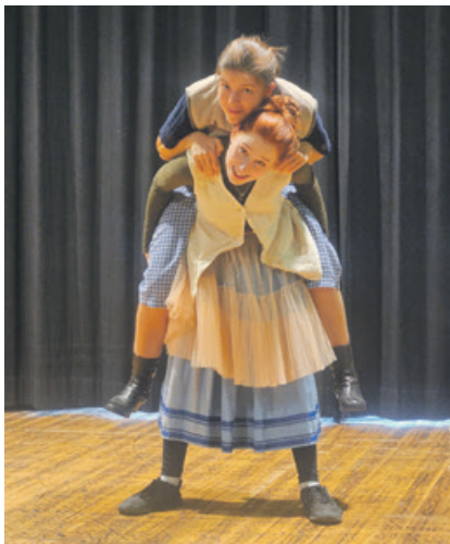
Freuen Sie sich also auf einen Familienbesuch mit Mama, Papa, Oma, Opa, Tanten, Onkeln und natürlich den Kindern.

In Szene gesetzt wird „Die kleine Hexe“ von Regisseurin Monique Hamelmann und ihrem Ausstatter Felix Remme. Beide gastieren erstmals am Bautzener Theater. Für die junge Regisseurin ist es auch die erste Arbeit für Kinder. Nach ihrem Studium insze-