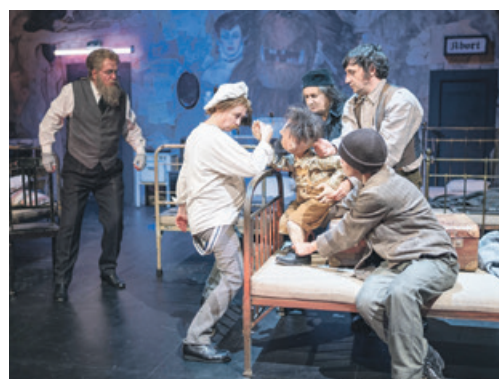
Lassen Sie sich diesen besonderen Theaterabend auf gar keinen Fall entgehen!